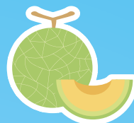
夕張メロンソフト (北海道)