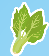
野沢菜ソフト (長野県)