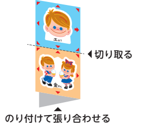
のり付けて張り合わせる