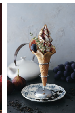
巨峰いちじくの ティーフレーバーソフト