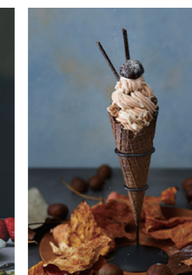
マロンと白餡、ホワイトチョコレートの モンブランソフト