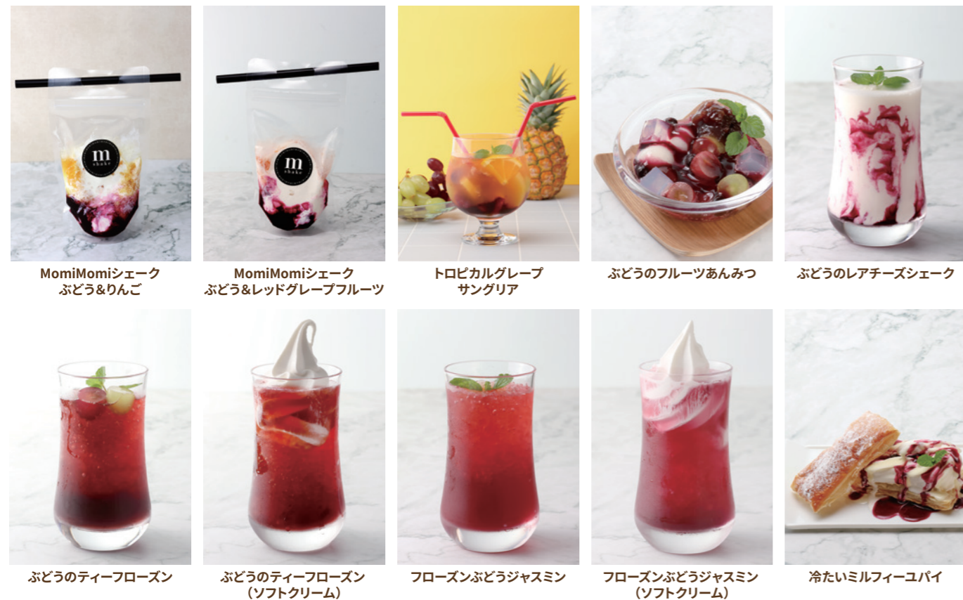
MomiMomiシェーク ぶどう&りんご

爽やかな気分になれる味とルックスの多彩なメニュー！ レシピの詳細は下記PDFよりご覧ください。