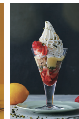
苺、レモン、ピスタチオの CREMIAパルフェ