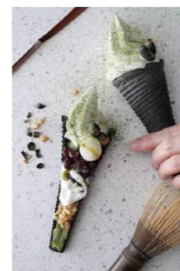
抹茶ぜんざいの クリスピーソフト