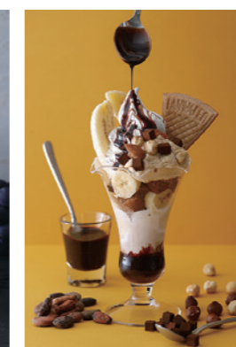
バナナとピーナッツバターの チョコレートパフェ