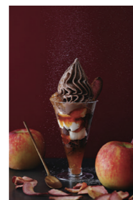
りんごと杏の CREMIAショコラ