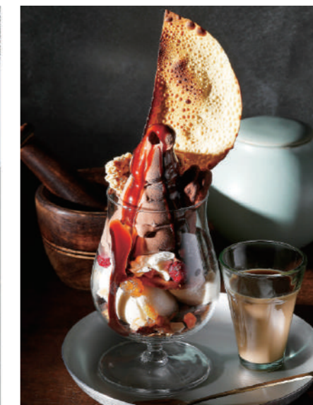
チャイとビターチョコレートの冬パルフェ