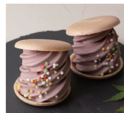
あずきソフト最中