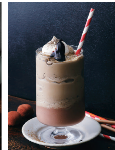
ビターチョコレートとほうじ茶のシェーク