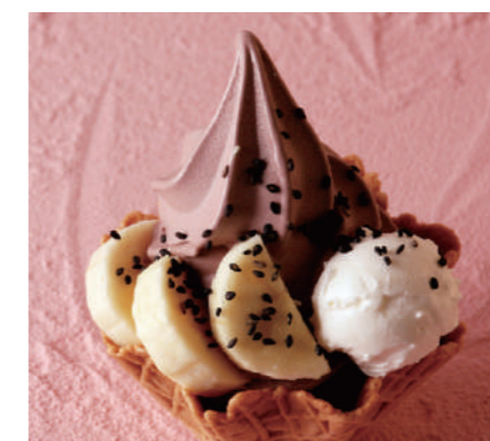
バナナとあずきソフトのミニバフェ