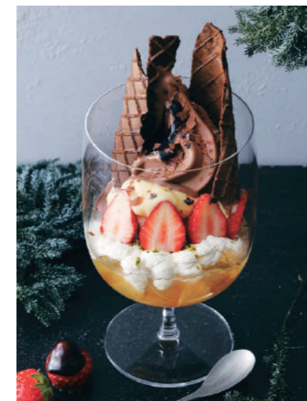
莓と柚子のショコラパルフェ