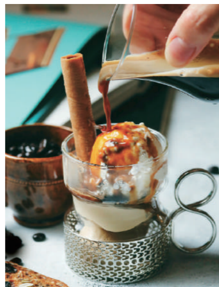
モカソフトとラムレーズンマスカルポーネアイスのアフォガート