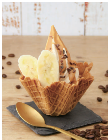
キャラメルモカボウル