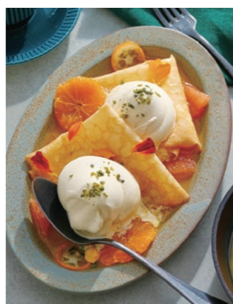
柑橘のクレープとロイヤルバニラソフトクリーム