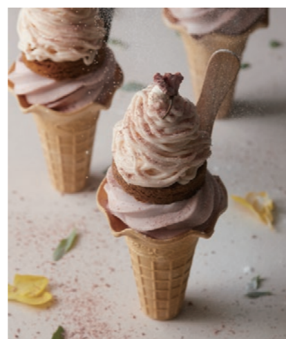
桜餡モンブランソフトクリーム