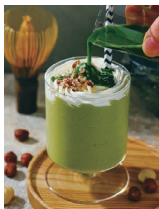
マカダミアナッツと特選抹茶の豆乳ヨーグルトスムージー