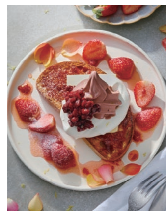
苺とあずきの春のオープンサンド