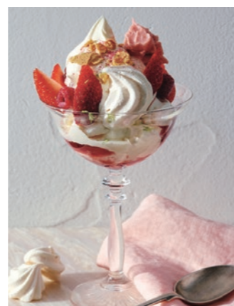
ラズベリーとあまおう苺のソーイートンメス