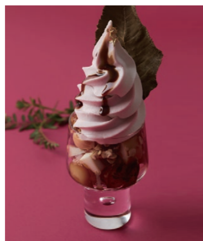
桜薫る大人の甘辛春パルフェ