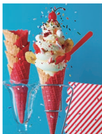
フルーツとお菓子なバニラソフトクリーム