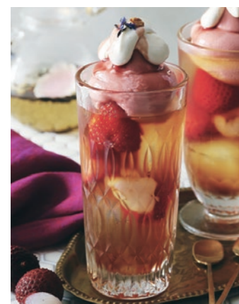
ライチ紅茶とあまおう苺のフルーツパンチフロート