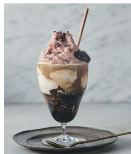
桜ソイシェークコーヒーゼリーとエスプレッソ