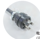
電源プラグ(20A引掛式)付属

※3:冷蔵機器及び冷凍機器の断熱材はフロン排出抑制法に基づく指定製品で、地球温暖化係数(GWP)の値が目標年度(2024年度)において、目標値(100)を上回らないことが製造事業者等に義務付けられています。