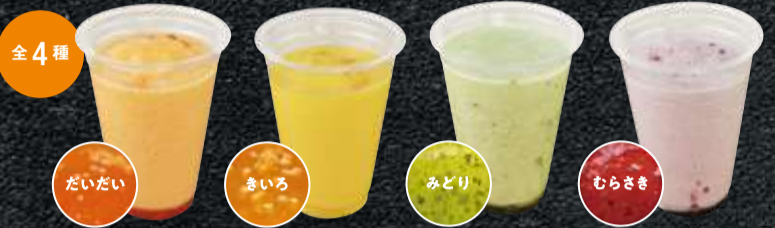
彩りスムージーベース(だいだい、きいろ、みどり、むらさき)商品規格