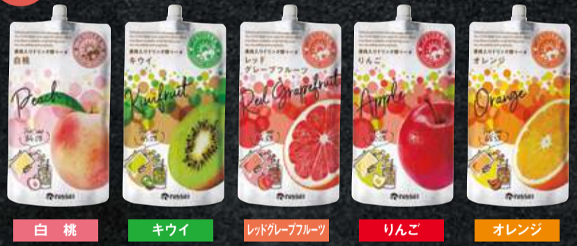
「ごほうび果樹園(果肉入りドリンク用ベース)」商品規格