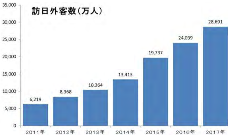
▲出典: 日本政府観光局(JNTO) (日世にてグラフ化)