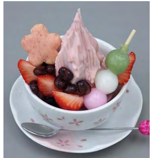
写真: 当社のデザートプランナーによる 「旬のソフトクリームミックスさくら」を アレンジしたパフェ