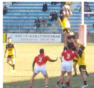
写真:2019年1月19日 ジャパンラグビートップリーグ カップ

広報内容問い合わせ先 日世株式会社マーケティング部企画グループ東京 担当:松島 郵便番号 142-0063 東京都品川区荏原 1-21-4 電話:03-5702-9352 FAX:03-5749-9095 press@nissei-com.co.jp